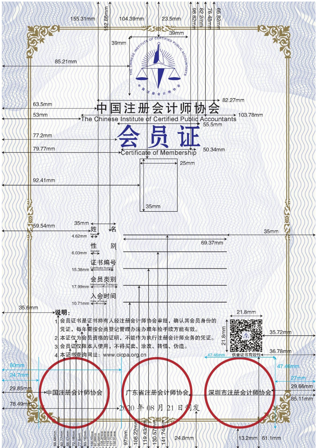
图3 非执业会员证证书特殊样式（以深圳为例）