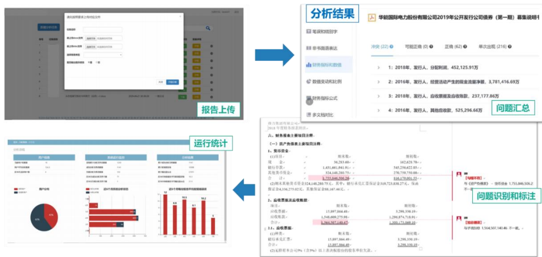
图4：“易审宝”使用示例 I

“易审宝”操作简洁明了，功能及页面的便捷性与友好性得到广大用户的一致认可，仅需“上传报告”-“等待3秒”即可获取一份带有差错提示标注的检测报告，能够支持 WOED、EXCEL、PDF 等各类文档的解析。