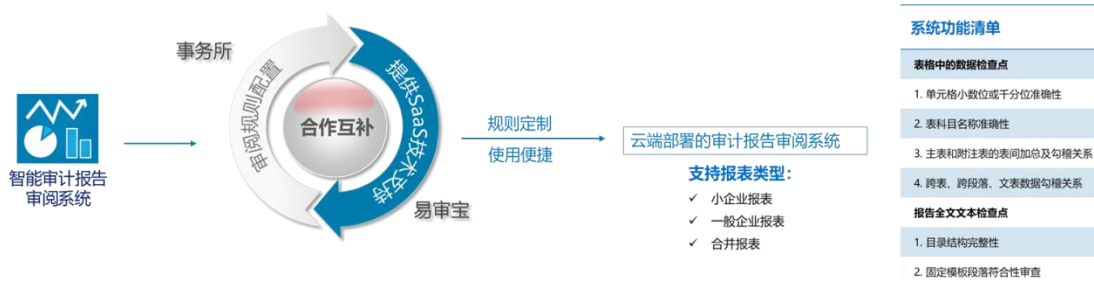
图 1 审计报告一致性审核