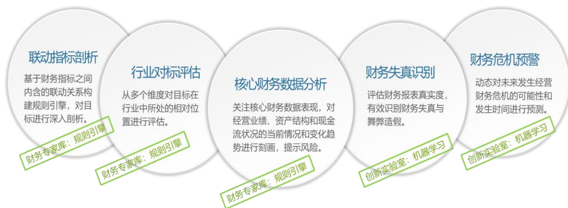
图 2 财务报表健康度检测

当前体系包含 5 个独立且互相支持的分析模型，具有高度的灵活性、可定制性和扩展性。通过报表间的指标勾稽，派生出数百条业务检查逻辑，形成了一个多方位立体纵深的公司财务运行状况深度检查。辅助会计师事务所对企业财务表现合理性进行判断。