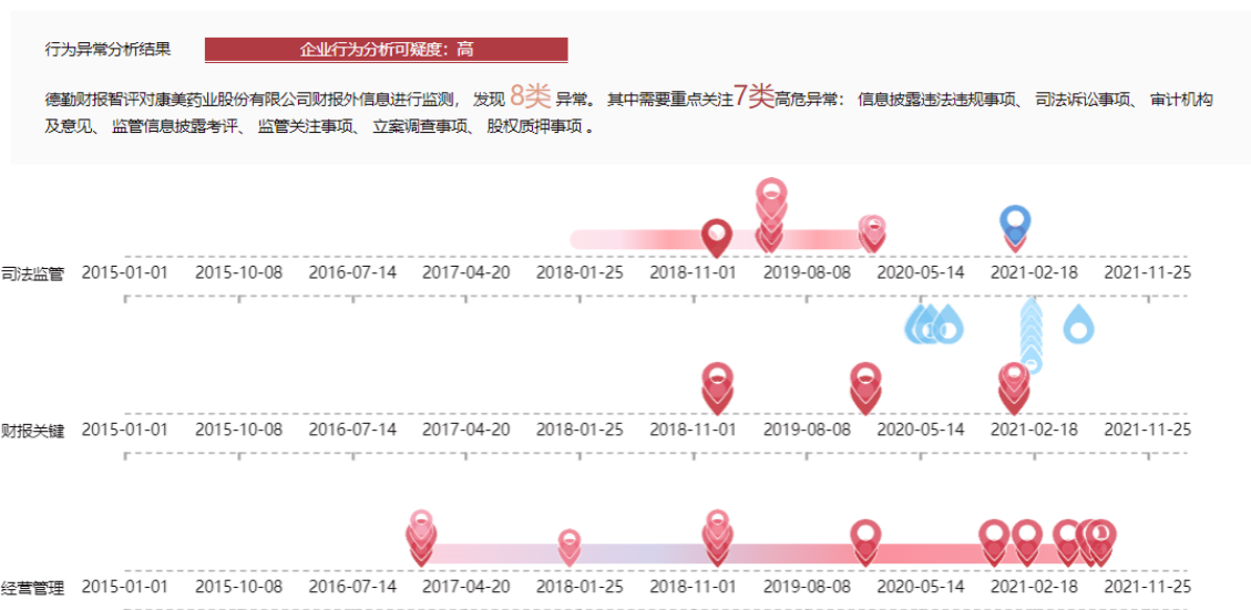
图 5 舞弊信号 - 股权质押

针对各异常点逐层剖析异常表现，辅以相关事实详情以及公开信息披露情况，提供企业行为异常的智评风险提示意见。捕捉企业财务造假动机，从源头甄破粉饰迷局。