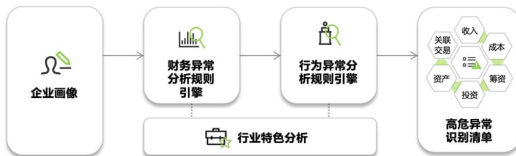
图 1 动机分析导向的财报粉饰分析框架

财报智评充分结合在审计服务中积累的财务造假识别经验与风险咨询服务中秉持的风险管理理念，创新性提出动机分析导向的财报粉饰分析框架（如图 1），利用大数据和人工智能技术搭建企业财务报告异常点识别规则引擎及智能分析系统，基于公开数据对于全市场发债或上市企业财务报告质量进行持续监控，帮助监管机构、投资银行、金融机构的投资、信贷类部门等客户扩大业务覆盖面，高效识别财报风险，提高财务报告研究分析效率。