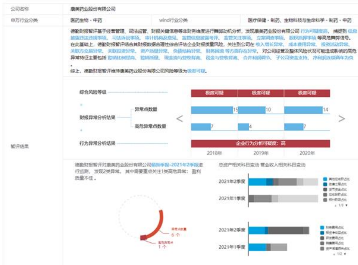
图 2 智评概览页面